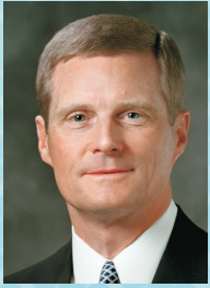
Ni Elder David A. Bednar Ng Korum ng Labindalawang Apostol