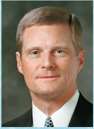
Mai vei Elder David A. Bednar