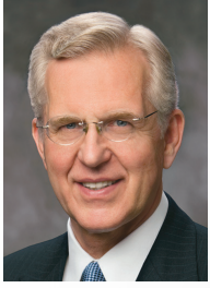
Fai 'e Eletā D. Todd Christofferson

'O e Kōlomu 'o e Kau 'Aposetolo 'e Toko Hongofulu Mā Uá