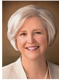
โดย นีลล์ เอฟ. แมร์ริออตต์ ที่ปรึกษาที่สองใน ฝ่ายประธานเยาวชน หญิงสามัญ