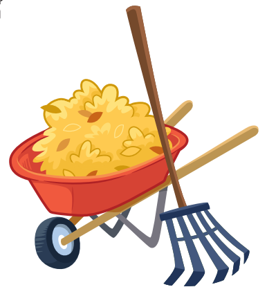
รับใช้ผู้อื่น