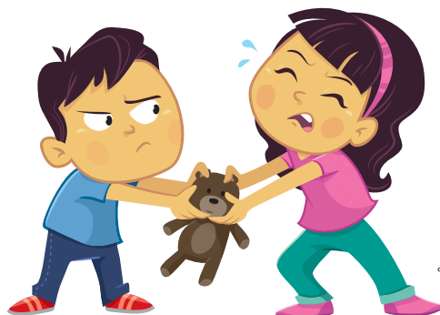
ทะเลาะกับพี่น้อง