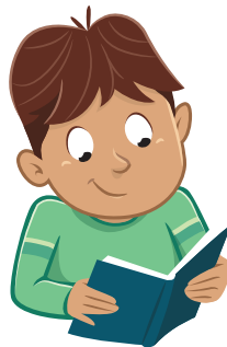
Tai'o i te mau pāpa'ira'a mo'a