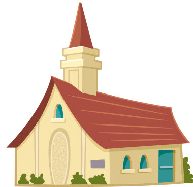
Haere i te purera'a