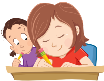
Punu i te ha'api'ira'a

Nā te mā'itira'a i te maita'i e ha'afātata nei ia tātou i te Metua i te Ao ra 'e ia Iesu Mesia. Tē tauturu ato'a nei te reira 'ia tātou 'ia 'oa'oa 'e 'ia vai pāuru. 'A tāpa'o menemene i te mau rāve'a e nehenehe ai tā 'outou e mā'iti i te maita'i.