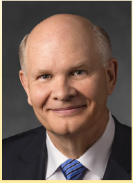
Por el élder Dale G. Renlund Del Cuórum de los Doce Apóstoles