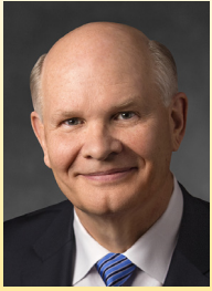
Ouderling Dale G. Renlund van het Quorum der Twaalf Apostelen