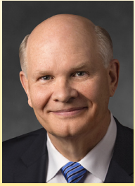
Vanhin Dale G. Renlund kahdentoista apostolin koorumista