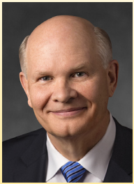
Dale G. Renlund du Collège des douze apôtres