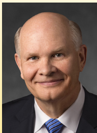
Av eldste Dale G. Renlund i De tolv apostlers quorum