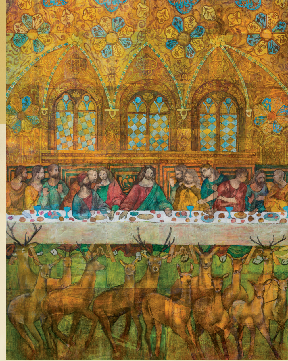
사브리나 질 스콰이어스, 최후의 만찬 (요한복음 13:1~35 참조), 미국

최 근 유타 주 솔트레이크시티 소재 교회 역사 박물관에서 제10회 국제 미술품 공모전이 열렸다. 다음은 공모전에 전시되었던 작품들의 일부이다. 전 세계 40여 개국에서 출품된 944개의 작품들 중 98개의 작품이 선정되었다. 예술가들은 구주이신 예수 그리스도의 삶과 관련된 일화 중 하나를 선택하여 자유롭게 창작할 수 있었다. 이런 일화의 해석이 각 그림, 조각, 도예품, 사진, 콜라주, 자수, 스테인드글라스, 그리고 디지털 작품에 잘 묘사되었다. 전시된 작품들은 lds.org/go/10art 에서 볼 수 있다.