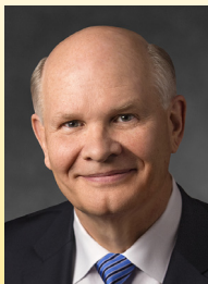
Ni Elder Dale G. Renlund

Sa Korum sa Napulog Duha ka mga Apostoles