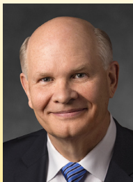
Fai 'e 'Eletā Dale G. Renlund 'O e Kōlomu 'o e Kau 'Aposetolo 'e Toko Hongofulu Mā Uā