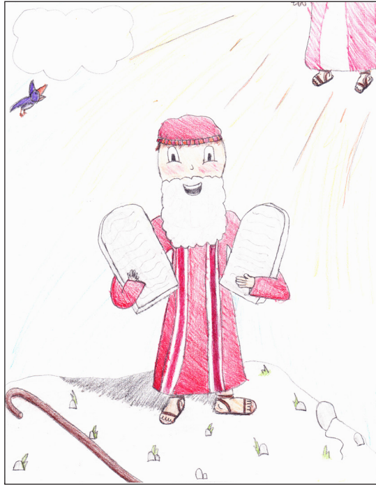
โดย อเล็กแซนดรา เอ็ม. อายุ 10 ขวบ, รัฐแมริแลนด์ สหรัฐอเมริกา