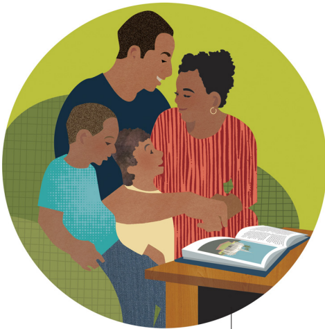
'Oku hanga 'e hono ako'i e ongoongolelei ki hotau ngaahi fāmili, 'o fakamālohia kinautolu ke nau mo'ui faivelenga 'i ha māmani 'oku kehe me'a 'oku ako'i ange ai.