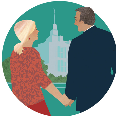
Te tau lava 'o fakahoko 'i he tempalé 'a e ngaahi ouaú ma'anautolu na'e pekia teeki ai ke nau fanongo ki he ongoongolelei 'i he mo'ui ni.