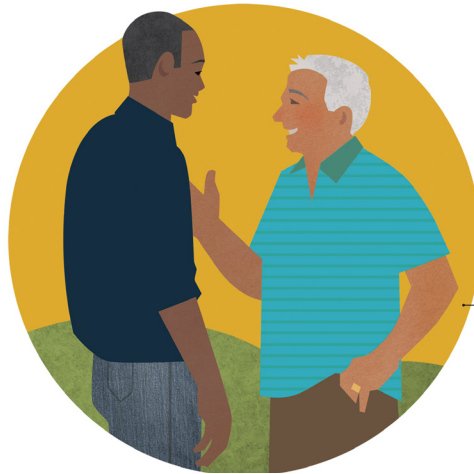
'E lava ke tau tokoni ke fakamafola e ongoongolelei 'i ha'atau talanoa pē ki ai mo e kakai.