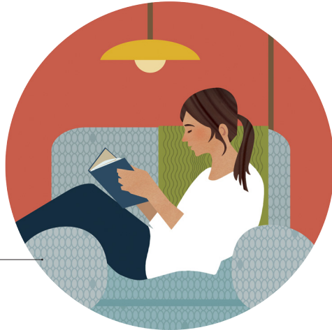
'Oku hanga 'e hono tauhi 'o e ngaahi fekaú pea mo hono fakamālohia 'étau ngaahi fakamo'oni, 'o 'omi kiate kitautolu ha fakava'e ke tokoni ki he mafola e ongoongolelei.