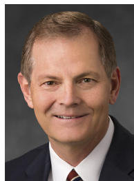
Ouderling Gary E. Stevenson van het Quorum der Twaalf Apostelen