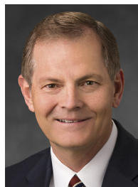
Vanhin Gary E. Stevenson kahdentoista apostolin koorumista