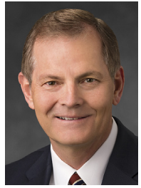
Par Gary E. Stevenson Du Collège des douze apôtres