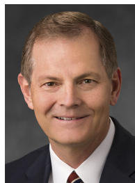
Anziano Gary E. Stevenson Membro del Quorum dei Dodici Apostoli