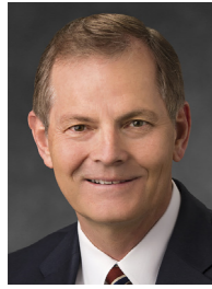
Старійшина Гарі Е. Стівенсон З Кворуму Дванадцятьох Апостолів