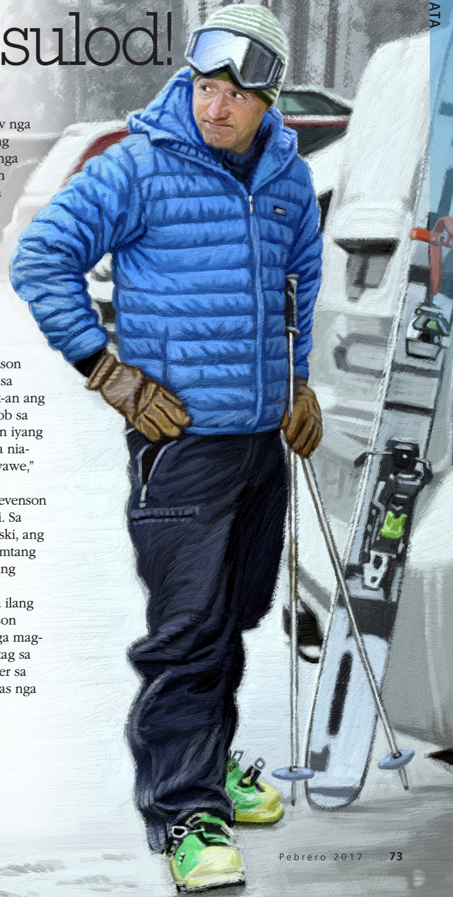
MGA PAGHULAGWAY PINAAGI NI DAN BURR

Ang pagpangita ug pagkaplag sa mga yawe sa ilang sakyanan nakapahinumdom nila si Elder Stevenson nga ang Langitnong Amahan dili motugot nga nga magpabilin ta nga magbarug sa katugnaw. Siya mihatag sa mga yawe sa priesthood ug katungod sa mga lider sa Simbahan sa pagtabang kanatong tanan nga luwas nga makauli ngadto Kaniya. ■