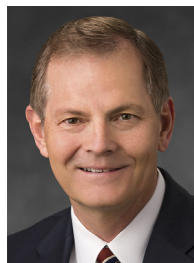
Ni Elder Gary E. Stevenson Sa Korum sa Napulog Duha ka mga Apostoles