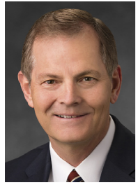
Ni Elder Gary E. Stevenson Ng Korum ng Labindalawang Apostol