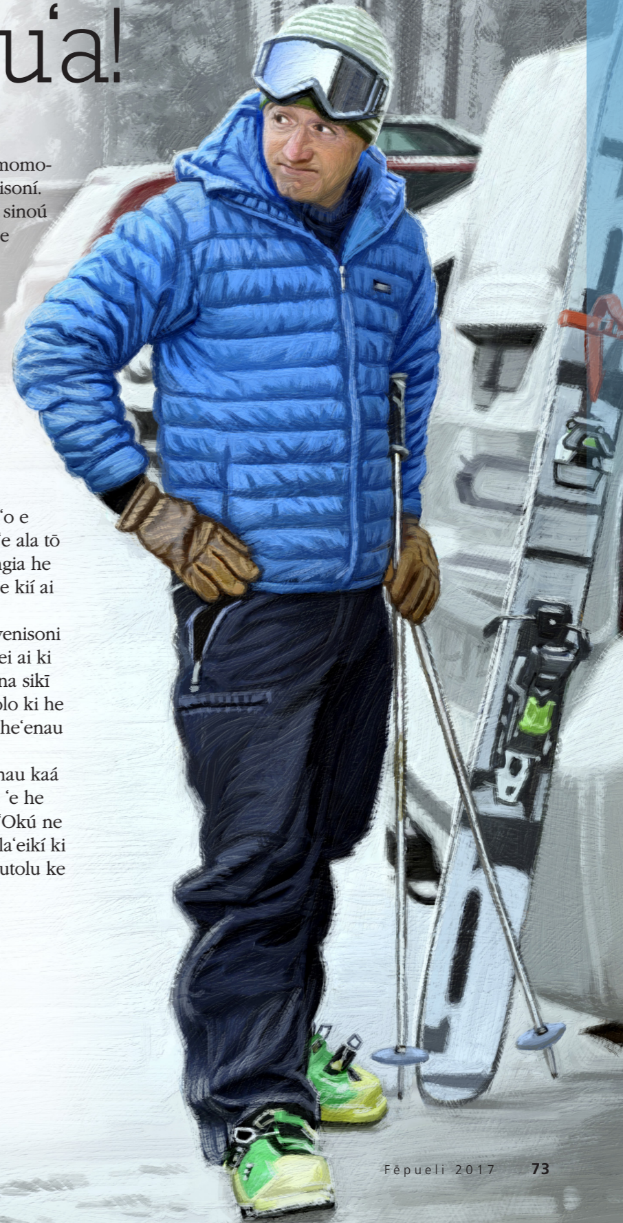
NGAAHI TĀ FAKATĀTĀ E DAN BURR

Na'e hanga 'e he lotú mo hono ma'u e kī 'o 'enau kaá 'o fakamanatu kia 'Eletā Sitivenisoni he 'ikai tuku 'e he Tamai Hēvaní ke tau tu'u tokotaha he momokó. 'Okú ne 'omi e ngaahi kī mo e mafai 'o e lakanga fakataula'eikí ki he kau taki 'o e Siasí ke tokoni 'i hono tataki kitautolu ke tau hao ki 'api kiate Iá. ■