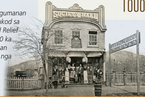
ELIZA R. SNOW 1866

Ang unang lawak-tigumanan sa Relief Society gitukod sa Salt Lake 15th Ward Relief Society. Kapin sa 120 ka mga lawak-tigumanan gitukod sa misunod nga 50 ka tuig.