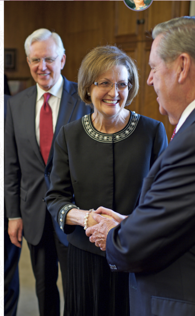
HJÆLPEFORENINGENS HOVEDPRÆSIDENT LINDA K. BURTON MØDES MED ÆLDSTERNE JEFFREY R. HOLLAND OG D. TODD CHRISTOFFERSON

om Jesus Kristus, så se på hans eksempel i skrifterne. Jesus Kristus kæmpede for kvinderne, han inkluderede kvinderne, og han forædlede kvinderne. Når jeg sidder i råd med brødrene, har jeg ofte kigget på dem og tænkt, at »dette er en lille del af, hvordan det må føles at være i Frelserens nærhed.«