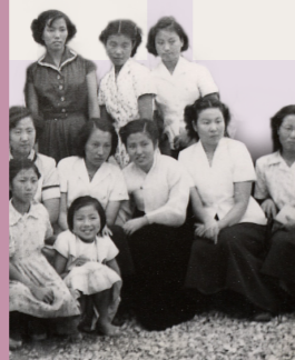
FOTO AF HJÆLPEFORENINGENS MINDEPLATTE, MED TILLÆGGE FRA KIRKEN HISTORISKE MUSEUM

Den første Hjælpeforening stiftes i Japan.