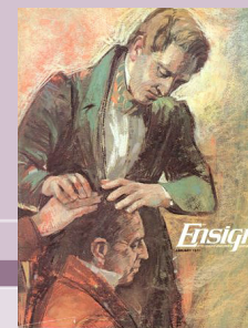
Ensign [Merkkiviiri] -lehti alkoi ilmestyä tammikuussa 1971.

Relief Society Magazine viimeinen numero.