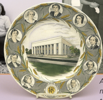
Apuyhdistyksen rakennuksen avoimien ovien tilaisuus.