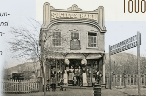
ELIZA R. SNOW 1866