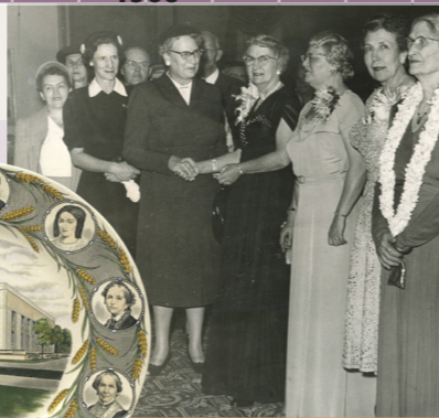
Apertura al pubblico dell'edificio della Società di Soccorso.