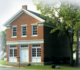
ЭММА СМИТ 1842 Г.