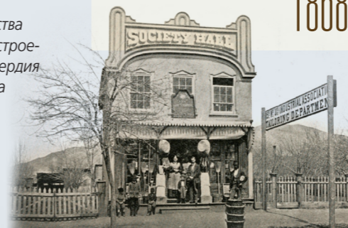
ЭЛИЗА Р. СНОУ 1866 Г.

Первое здание Общества милосердия было построено Обществом милосердия Пятнадцатого прихода Солт-Лейк-Сити. За следующие пятьдесят лет было возведено более 120 подобных зданий.