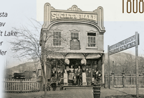
ELIZA R. SNOW 1866