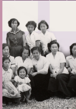
FOTOGRAFI AV HJÄLPFÖRENINGENS MINNSTALLRIK, MED TILLSTÅND AV KYRKANS HISTORISKA MUSEUM

De första hjälpföreningarna organiserades i Japan.