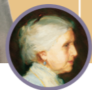
EMMELINE B. WELLS 1910

Tidningen Relief Society Magazine började publiceras. Utgivningen av Woman's Exponent avslutades.