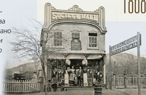
ЕЛАЙЗА Р. СНОУ 1866

Перший зал для проведення зборів Товариства допомоги було збудовано Товариством допомоги 15-го Солт-Лейкського приходу. Понад 120 залів було збудовано упродовж наступних 50 років.