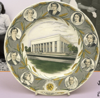
งาน โอเพ่นเฮาส์ตึกสมาคมสงเคราะห์