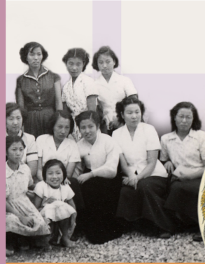
ภาพถ่ายงานที่ระลึกของสมาคมสงเคราะห์

1949 จัดตั้งสมาคมสงเคราะห์ครั้งแรกในญี่ปุ่น