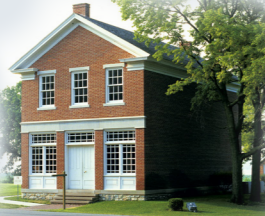
เอมมา เอช. สมิธ 1842