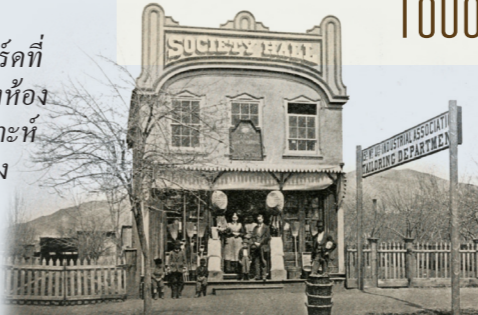
เอลิซา อาร์. สโนว์ 1866

สมาคมสงเคราะห์วอร์ดที่ 15 ซอลท์เลคกอสส์สร้างห้อง ประชุมสมาคมสงเคราะห์ แห่งแรก ก่อสร้างห้อง ประชุมกว่า 120 ห้อง ใน 50 ปีต่อมา