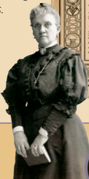
EMMELINE B. WELLS 1910