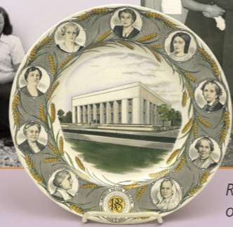
Relief Society Building open house.