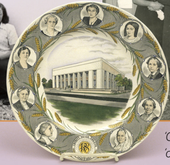
'Oupeni hausi e Fale 'o e Fine'ofa.