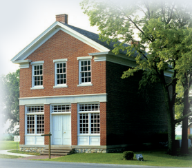
에머 에이치 스미스 1842