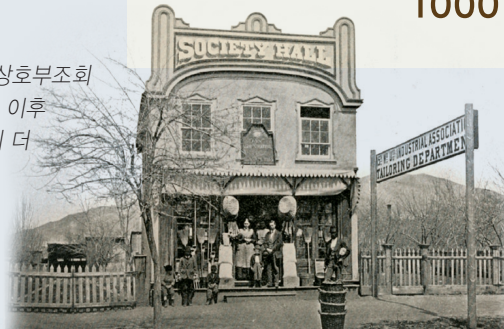
엘리자 알 스노우 1866

솔트레이크 제15와드 상호부조회가 최초로 상호부조회 모임 회관을 지었으며, 이후 50년 동안 120여 곳이 더 마련되었음.