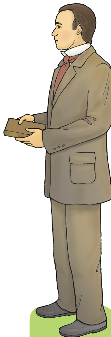
Parley P. Pratt

Da Kirken var blevet organiseret, ønskede vor himmelske Fader, at alle skulle høre om evangeliet. Den første missionær var Joseph Smiths bror Samuel. Hyrum, Josephs storebror, underviste også andre om evangeliet. En dag fortalte en mand ved navn Parley P. Pratt Hyrum, at han havde brugt hele dagen på at læse Mormons Bog. Hyrum fortalte ham mere om Kirken, og han blev døbt. Derefter tjente Parley som missionær. Han blev leder i Kirken.