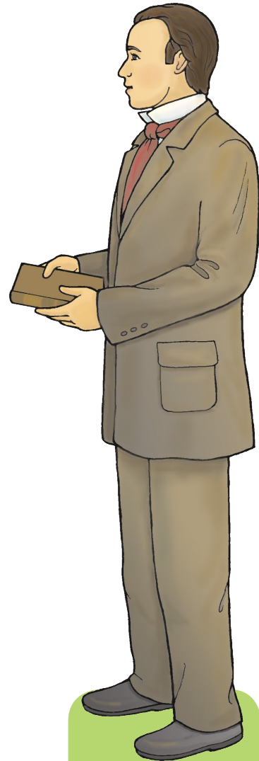
Փարլի Պ. Պրատ

Եկեղեցու կազմավորումից հետո Երկնային Հայրը ցանկացավ, որ բոլորը լսեն ավետարանի մասին: Առաջին միսիոները եղավ Ջոզեֆ Սմիթի եղբայր Սենյունելը: Հայրումը՝ Ջոզեֆի մեծ եղբայրը, նույնպես, ուսուցանում էր ուրիշներին ավետարանի մասին: Մի օր Փարլի Պ. Պրատ անունով մի մարդ ասաց Հայրումին, որ ամբողջ օրն անցկացրել էր Մորմոնի Գիրքը կարդալով: Հայրումը նրան ավելի շատ բան ուսուցանեց Եկեղեցու մասին, և նա մկրտվեց: Հետո Փարլին ծառայեց միսիայում: Նա դարձավ Եկեղեցու ղեկավար: