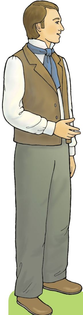
ហែរុម ស្ទីធី