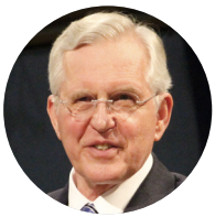
Par D. Todd Christofferson du Collège des douze apôtres