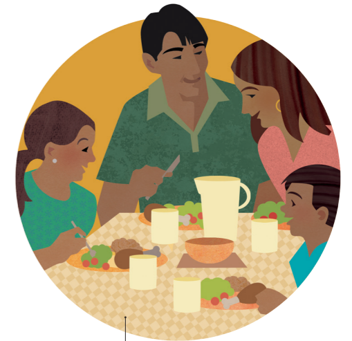
Participer à des activités et traditions familiales saines