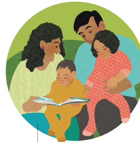
Rendre notre culte à Dieu par la prière et l'étude des Écritures en famille, par la soirée familiale, et en allant à l'église et au temple en famille