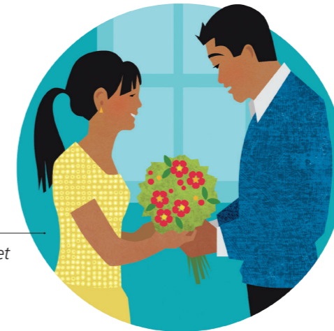
Être gentil, demander et accorder le pardon