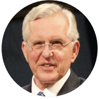
Elder D. Todd Christofferson