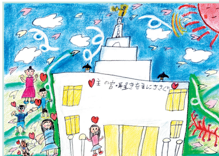
Der Sapporo-Tempel in Japan, Harada K., 8, Präfektur Kanagawa, Japan