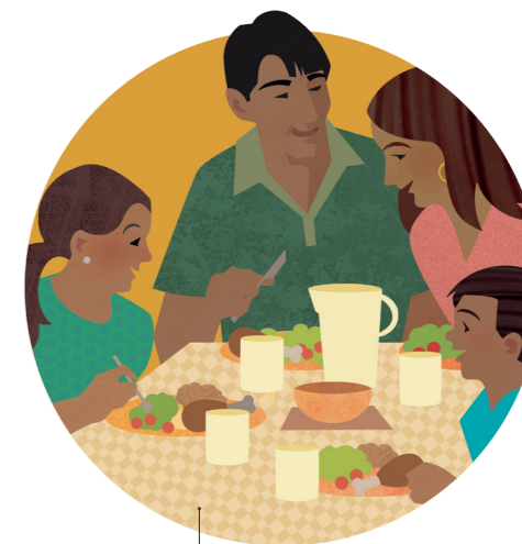
Delta i sunda familjeaktiviteter och traditioner