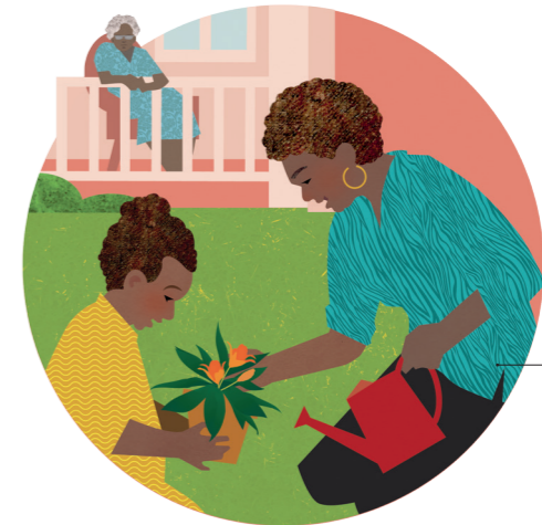
Fakahoko ha ngāue tokoni