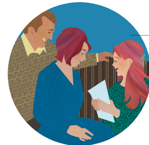
Fakafanongo mo fakahaa'i e faka'apa'apá