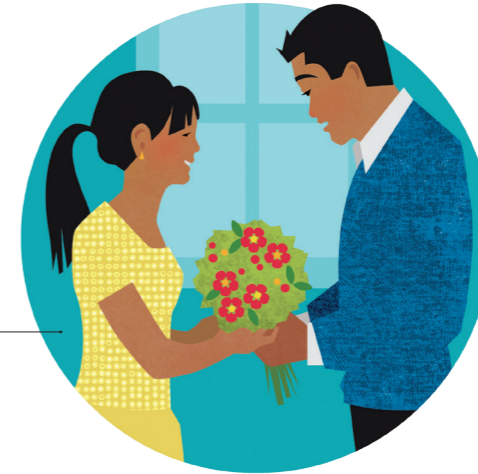
Anga'ofa, kole fakamolemole, mo fa'a fakamolemole

Founga ke fakamālohia ai e ngaahi vā fetu'utaki fakafāmilí 'i hono mo'ui 'aki e ongoongoleleí: