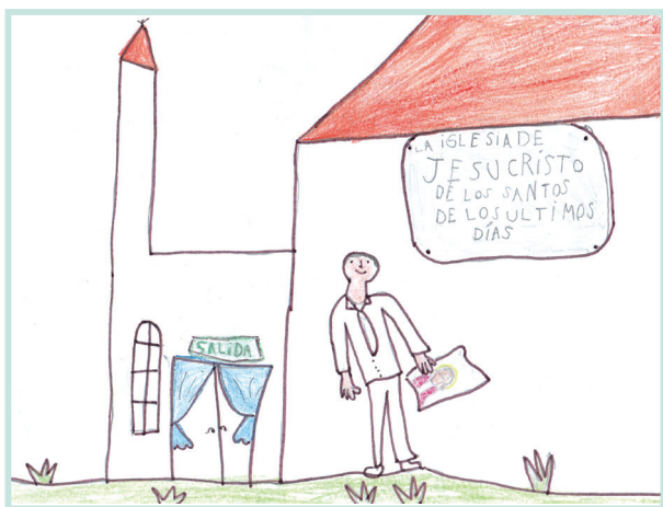
'I he'eku teuteu ke papitaisó, na'a ku ki'i ongo'i lotosi'i. Ka 'i he taimi pē na'a ku hifo ai ki he va'i, na'a ku ongo'i fiefia 'aupito.